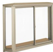
台形出窓 (前面引違い)