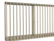
たて面格子付サッシ