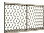
クロス面格子付サッシ