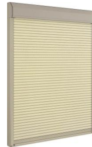
シャッター付サッシ (手動)