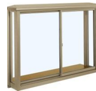
角形出窓 (前面引違い)