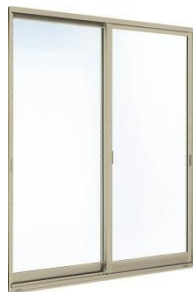
引違いサッシ (テラス)